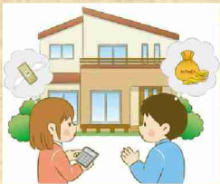
住宅購入を考えている