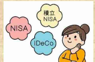
資産形成に興味がある