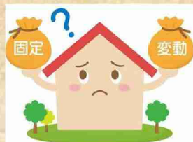
変動か固定か悩む