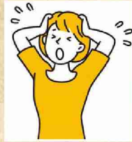
住宅ローンで 失敗したくない